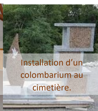
Installation d'un colombarium au cimetière.