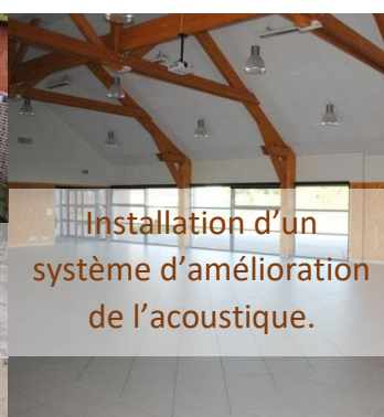
Installation d'un système d'amélioration de l'acoustique.