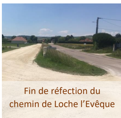
Fin de réfection du chemin de Loche l'Evêque

Le budget d'investissement 2022 est cette année principalement axé sur les projets débutés en 2021 qui s'achèveront en 2022. Le projet des distributeurs alimentaires est fortement subventionné mais les subventions ne seront versées qu'une fois toutes les dépenses réglées, il est donc important que ces dépenses soient budgétées en intégralité.