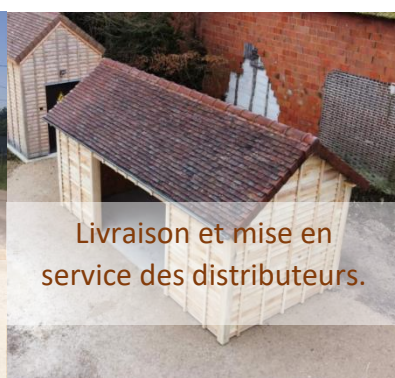
Livraison et mise en service des distributeurs.